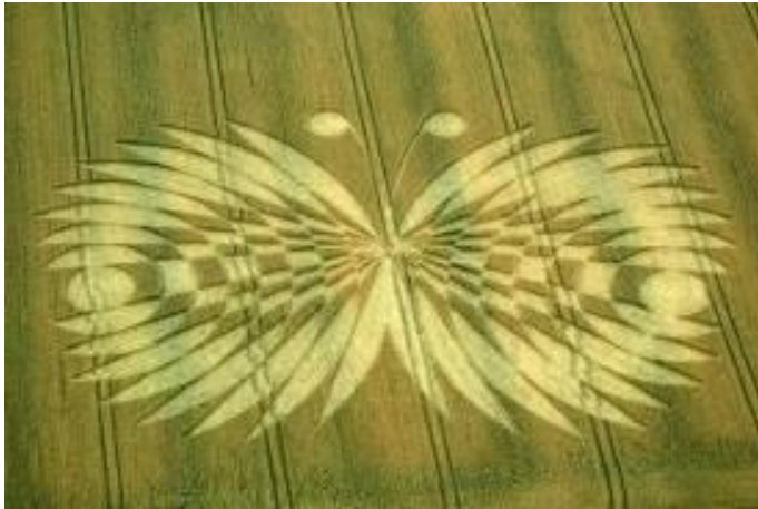
Graancirkel bij Hailey Wood bij Ashbury, 16 juli 2007.

raakte: ‘Voorbij de grens van het lineaire bestaan wachten mysterieuze werelden op ontdekking. Jullie zijn de pioniers van een nieuw bewustzijn, gebaard uit liefde en mededogen. Wanneer jullie de weg bereiden, zullen anderen volgen.’ 3