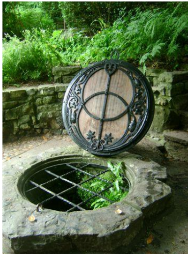
De Chalice Well in Glastonbury.